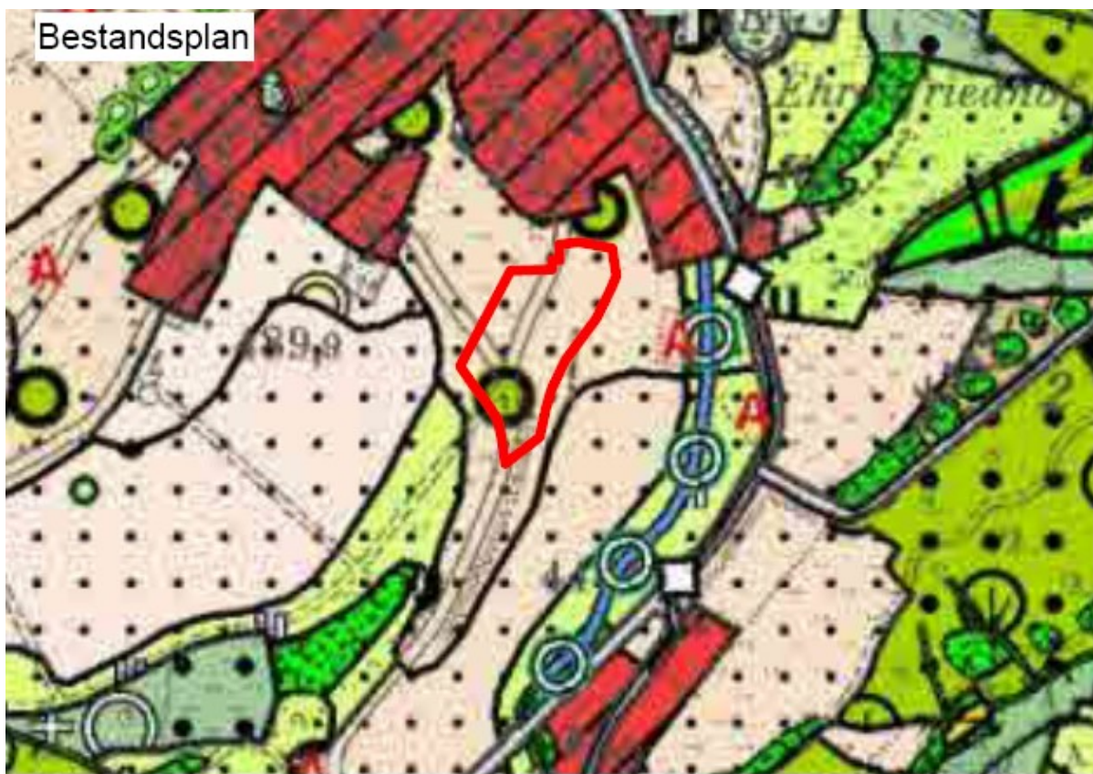
(unmaßstäbliche Darstellung „vor der Änderung“)

Die Abgrenzung des Änderungsbereiches des Flächennutzungsplanes sind in den nachfolgenden Abbildungen dargestellt: